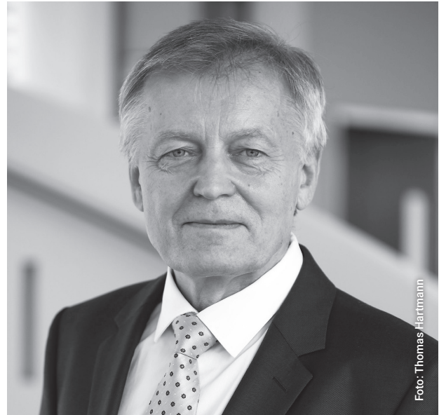
Dr. Mikhail Eremets verstarb Mitte November 2024 im Alter von 75 Jahren. Dr. Mikhail Eremets passed away in mid-November 2024 at the age of 75.

Diese und andere herausragende wissenschaftliche Leistungen sorgten in der weltweiten Wissenschaftsgemeinschaft für große Begeisterung und führten zu zahlreichen hochrangigen internationalen Auszeichnungen und Preisen. So erhielt Eremets unter anderem den Matthias-Preis 2022, den McGroddy-Preis 2020 und den Falling Wall Breakthrough Award in Physical Sciences 2020. Erst im letzten Jahr hielt er die Bragg Lecture 2023, eine sehr renommierte Vorlesung des University College London. 2015 zählte er im Ranking der Zeitschrift Nature zu den