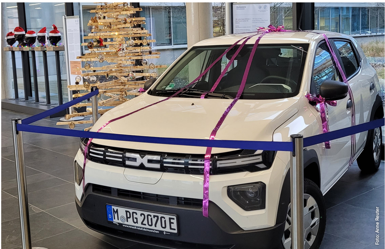
Das neue E-Auto für Besorgungsfahrten der Hausverwaltung. | The facility management’s new electric car for errands.