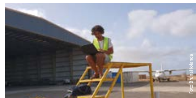
Arbeitsplatz im Flugzeug oder vor dem Hangar: Bei einer Forschungsmission muss man flexibel sein. | Working in a plane or in front of the hangar: during a research campaign one has to be flexible.