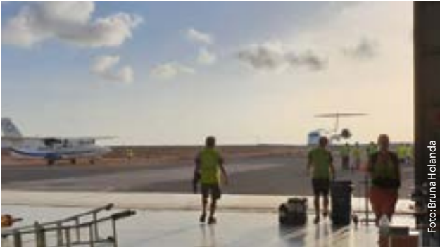
Der Arbeitstag der Forscher ging nach dem Sonnenuntergang weiter. The working day of the researchers continued after sunset.

„Die Kampagne war aufregend und spannend, aber auch sehr arbeitsintensiv. Ich habe sehr viel Neues gelernt, zum Beispiel über die Abläufe im Flugbetrieb, wie etwa Sicherheitsaspekte beim Fliegen oder Pilotensprache. Ich habe auch jetzt ein tieferes Verständnis über das, was die anderen Gruppen, die Teil der Mission waren, messen. Aus wissenschaftlicher Sicht war CAFE-Africa für mich persönlich auch erfolgreich, weil das Gerät, das ich dafür über 1,5 Jahre lang vorbereitet und zertifiziert habe, bei allen Flügen erfolgreich gemessen hat.“