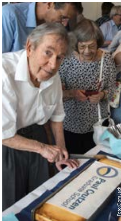
Paul Crutzen bei der Einweihung der Graduate School. | Paul Crutzen attended the Graduate School Inauguration.

Die PCGS ist ein Promotionsprogramm im Bereich der Erdsystemforschung. In diesem interdisziplinären Programm nehmen auch Doktoranden mit einem Studium der Biologie oder der Geowissenschaften teil. Das Ziel des Programms ist es, den Doktoranden eine umfassende Betreuung über die eigene Arbeitsgruppe und das Thema der Doktorarbeit hinaus zu bieten. Mitglieder des Programms sind alle MPIC-Doktoranden.