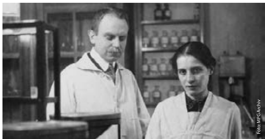
Otto Hahn und Lise Meitner in ihrem Labor. | Otto Hahn and Lise Meitner in their laboratory.

To mark the occasion of the Max Planck Society's foundation 70 years ago and the 50th anniversary of the deaths of Lise Meitner and Otto Hahn, the Max Planck Institute for Chemistry held a historical symposium. The subject was the background to the discov-