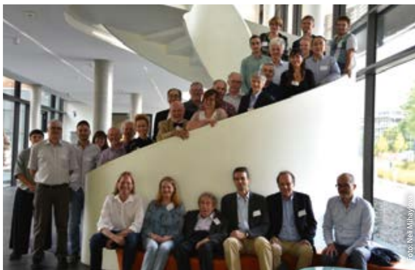
Nobelpreisträger Paul Crutzen (vorne 3 v.l.) gemeinsam mit den Teilnehmern des Treffens der Arbeitsgruppe Anthropozän. | Nobel Laureate Paul Crutzen together with the participants in the gathering of the Anthropocene Working Group.

Das Max-Planck-Institut für Chemie war im September Gastgeber des Treffens der Arbeitsgruppe Anthropozän. Die Mitglieder tauschten sich in Mainz über die wissenschaftlichen Grundlagen und gesellschaftlichen Auswirkungen des von Menschen geprägten Zeitalters aus. Die Gruppe wurde 2009 gegründet, mit dem Ziel die Etablierung und Auswirkung des Anthropozäns als neues geologisches Zeitalter zu besprechen.