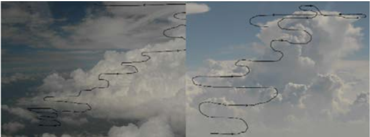
Mit dem Forschungsflugzeug HALO durch die Wolken. Die Skizze zeigt, wie ein Flugmuster aussehen könnte. With the research airplane HALO through the clouds: The sketches indicate how flight pattern could look like.

Der Zeitplan der Kampagne ist eng gesteckt: Innerhalb von 15 Flugtagen wollen die Forscher fünf verschiedene Missionstypen durchführen. So soll unter anderem untersucht werden, wie sich Wolken in sauberer Urwaldluft von denen in verschmutzten und entwaldeten Regionen unterscheiden. Einige Flüge werden sich der Frage widmen, wie verschiedene Arten von konvektiven Wolken den Stoff-, Strahlungs- und Energietransport in der Atmosphäre beeinflussen.