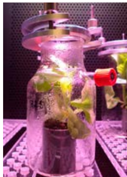
Tabakpflanzen in einem geschlossenen Gefäß. Tobacco plants in a sealed container.